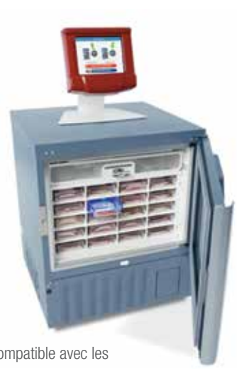
Compatible avec les réfrigérateurs standard et les appareils HaemoBank

Le système de gestion du sang en urgence BloodTrack contrôle, suit et surveille l'accès aux produits sanguins d'urgence, notamment les unités destinées au protocole de transfusion massive (MTP), dans les services d'urgence, les services de traumatologie ou les centres de chirurgie ambulatoires en sécurisant les lieux de stockage nouveaux ou existants à l'aide d'un système de verrouillage électromagnétique contrôlé par logiciel. Le personnel soignant autorisé bénéficie ainsi d'un accès rapide et sécurisé aux produits sanguins d'importance vitale quand et où il en a le plus besoin.