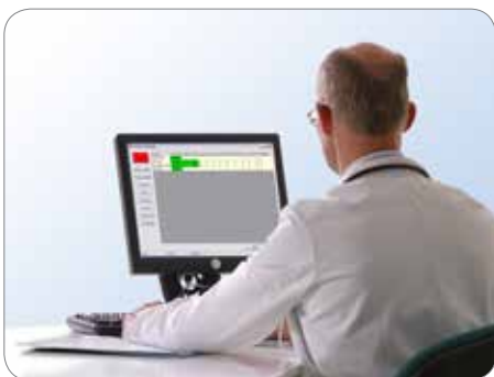
Tableau de bord central

Le logiciel BloodTrack Tx® offre une solution de vérification de transfusion au chevet du patient bénéficiant de l'accréditation 510(k) de la FDA. Ce logiciel vérifie électroniquement que le bon sang est transfusé au bon patient à son chevet et enregistre les transfusions, les signes vitaux du patient, les réactions et les identifiants du personnel pour assurer la conformité aux règles d'hémovigilance. Il peut aussi générer et imprimer des étiquettes de collecte d'échantillons de banque de sang.