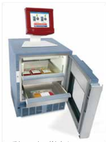
Compatible avec les réfrigérateurs standard et les appareils HaemoBank®

Un stockage de produits sanguins sûr, sécurisé et entièrement traçable