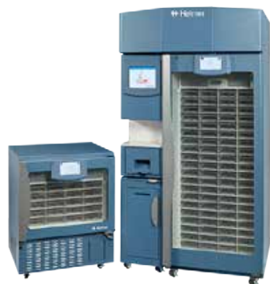
Compatible avec les appareils HaemoBank

Le système de gestion du sang BloodTrack Just-in-time attribue rapidement le bon produit sanguin au bon patient où il le faut, quand il le faut. Cela élimine la nécessité de tester la compatibilité et d'étiqueter à l'avance les produits sanguins, réduisant ainsi la charge de travail du personnel médical et de la banque de sang. Le logiciel est conçu pour être utilisé avec la BloodTrack HaemoBank et constitue ainsi un service de transfusion automatique virtuel disponible 24 h/24, 7 j/7.